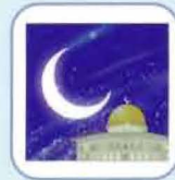
le jeûne du Ramadan